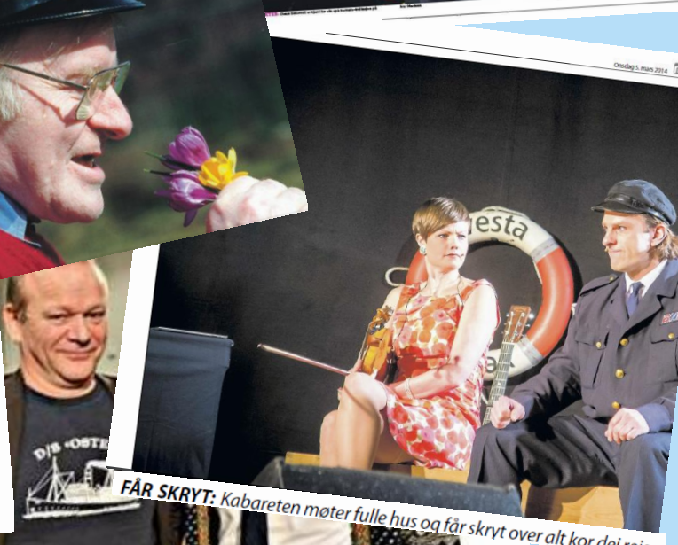
FÅR SKRYT: Kabareten møter fulle hus og får skryt over alt kor dei reiser